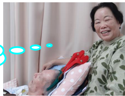
私の大事なトナカイさん