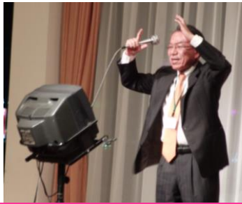
ここでしか聞けない！ 院長の熱唱です。