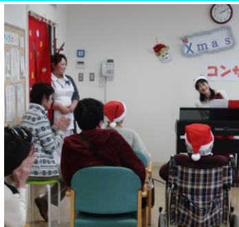
今日の司会はいつも明るいトナカイさんです。