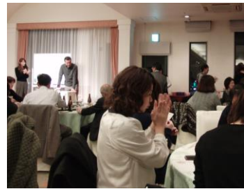
何が当たっても嬉しい？ 恒例のビンゴ大会です。