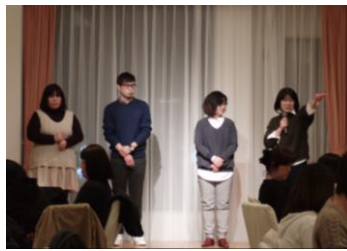
“慈生会の忘年会” 病院と関連施設の職員さんとの合同で行いました。