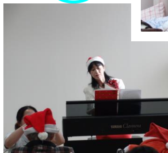
ケーキが待ち遠しいな。