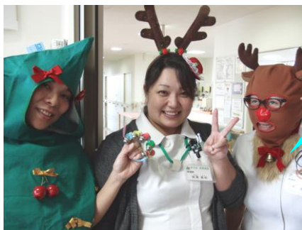
さて私は誰でしょう。